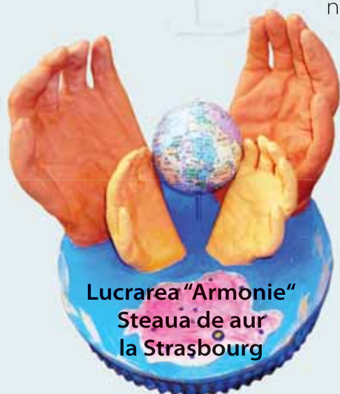
Lucrarea "Armonie" Steaua de aur la Strasbourg